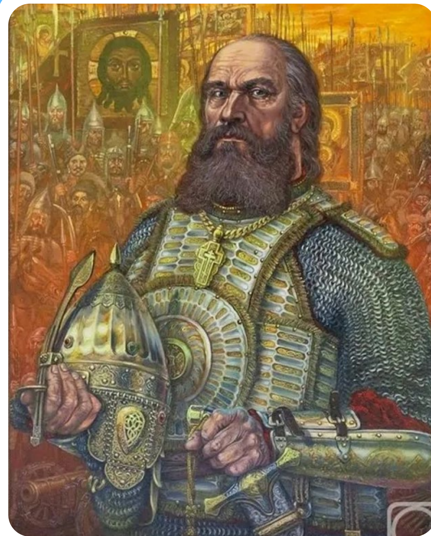
КНЯЗЬ МИХАИЛ ИВАНОВИЧ ВОРОТЫНСКИЙ