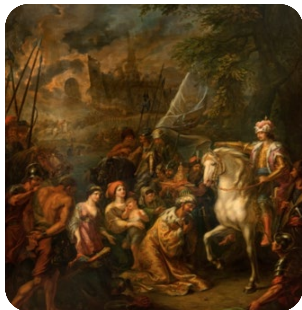
«Вступление Иоанна IV в завоеванную у татар Казань» г. Угрюмов, 1800

Представитель древнего рода Воротынских.