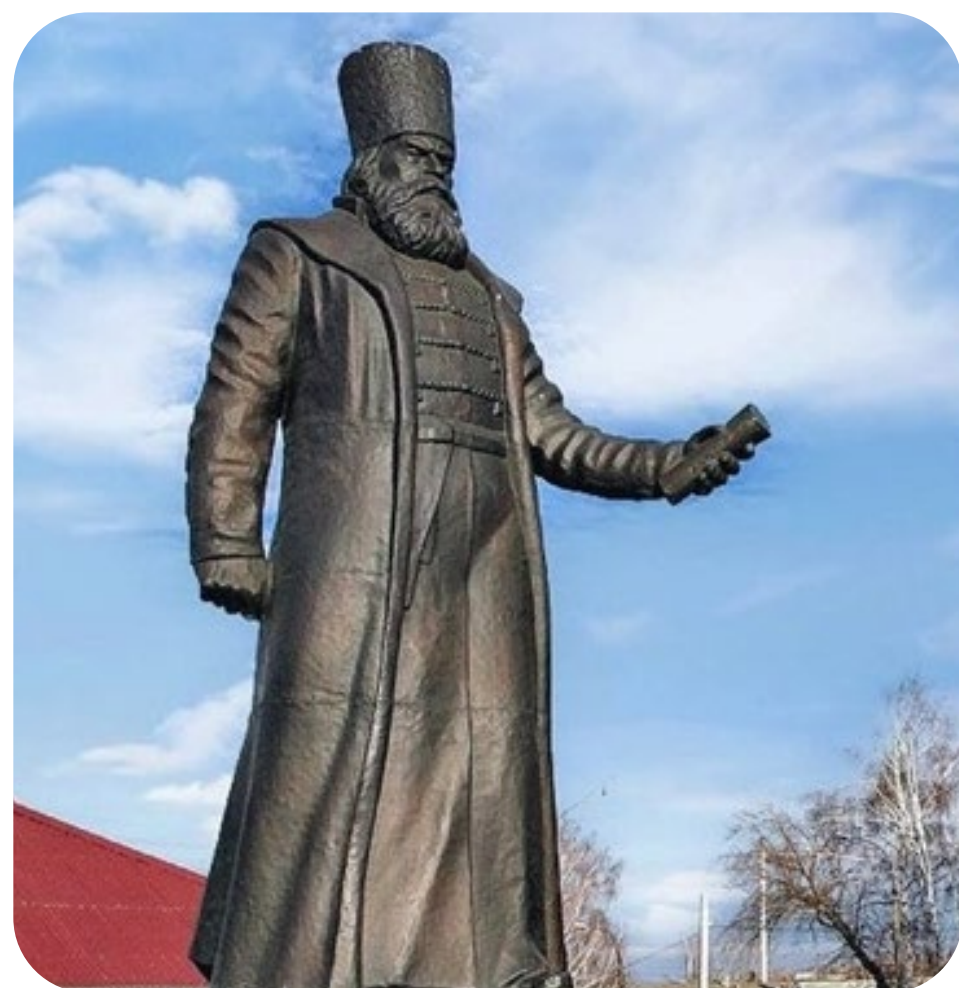
Михаил Иванович Воротынский (около 1516–1573)

Выдающийся полководец эпохи Ивана Грозного.